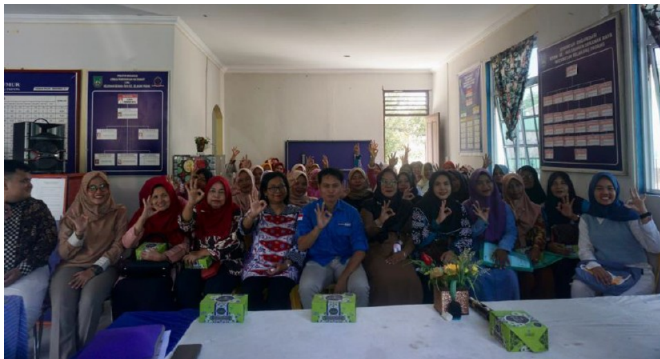
Gambar 3. Tim PKM dengan Pelaku Pariwisata Belakang Padang Sumber: Tim PKM, 2026

Pengembangan kuliner sebagai produk wisata juga perlu diintegrasikan dengan paket wisata maritim. Kuliner dapat menjadi bagian dari rute kunjungan, event lokal, kegiatan budaya, atau pengalaman wisata berbasis masyarakat. Integrasi ini akan membuat kuliner memiliki posisi yang lebih kuat dalam ekosistem pariwisata. Wisatawan tidak hanya datang untuk menikmati pemandangan atau aktivitas maritim, tetapi juga memperoleh pengalaman mencicipi kuliner khas masyarakat setempat. Dengan demikian, kuliner lokal dapat memperpanjang durasi kunjungan dan meningkatkan belanja wisatawan di wilayah tersebut.