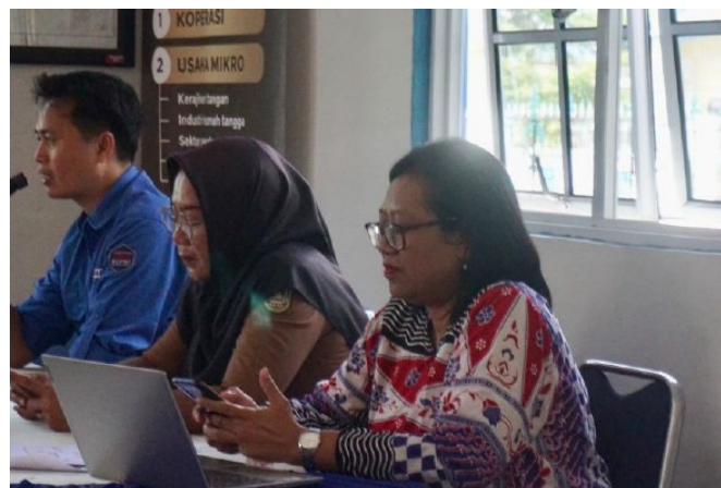
Gambar 2. Penyampaian Materi Pariwisata Perbatasan

Kegiatan pengabdian kepada masyarakat dilaksanakan dengan menempatkan warga sebagai subjek utama dalam proses pengembangan kuliner wisata. Pendekatan ini dilakukan melalui sosialisasi, diskusi, tanya jawab, dan pendampingan yang memungkinkan masyarakat menyampaikan pengalaman serta pandangan mereka. Proses ini penting karena masyarakat merupakan pihak yang paling memahami kondisi lokal, jenis kuliner yang berkembang, serta hambatan yang dihadapi dalam kehidupan sehari-hari. Melalui keterlibatan masyarakat, kegiatan pengabdian tidak hanya menjadi proses penyampaian materi, tetapi juga ruang dialog untuk menyusun gagasan bersama. Dengan demikian, pemberdayaan masyarakat menjadi inti dari pelaksanaan kegiatan.